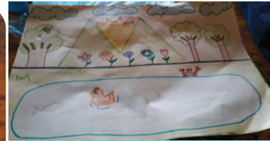
Niños y Niñas en un dibujo muestran como les gustaría que fuera su Comunidad, con muchos árboles, flores, agua, peces.